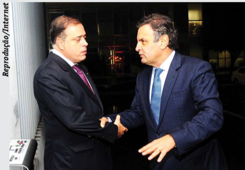
Paulo Abi-Ackel e Aécio

Ainda não é uma decisão oficial, mas segundo comentários de pessoas próximas, o deputado Aécio Neves (PSDB) está sendo convencido pelo presidente de seu partido, o parlamentar federal Paulo Abi-Ackel, a aceitar o desafio de ser candidato ao Senado. Esse assunto foi ventilado intensamente na última semana, inclusive com pedido de opinião de lideranças municipais que estiveram no ninho tucano em Belo Horizonte. De concreto existe apenas uma fala do próprio Aécio, sinalizando a sua intenção de disputar o pleito à Presidência da República.