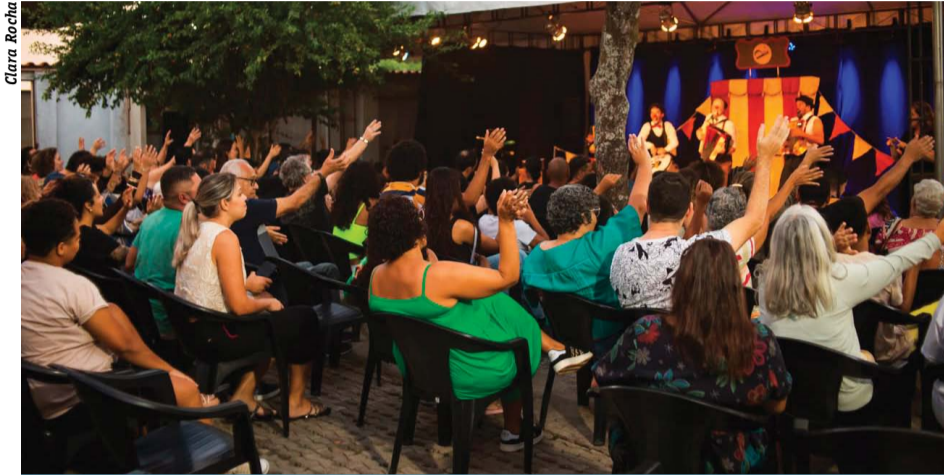
Evento terá grupos de todas as regiões do país