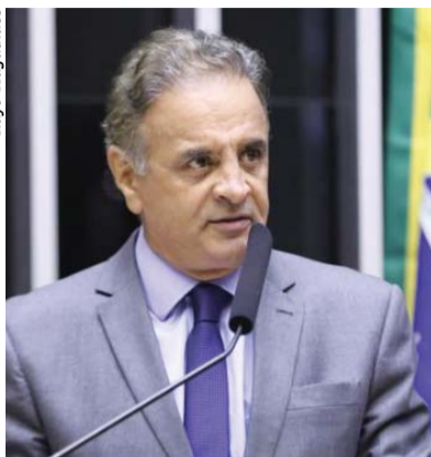
Votos de Aécio são repartidos no interior do Estado