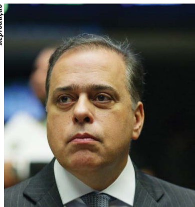
Paulo Abi-Ackel é presidente do PSDB em Minas