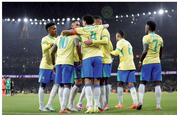
Equipe estreia no dia 13 de junho contra o Marrocos

Enquanto nomes experientes enfrentam críticas, jovens como Erick e Estevão aparecem como símbolos de renovação e esperança. O