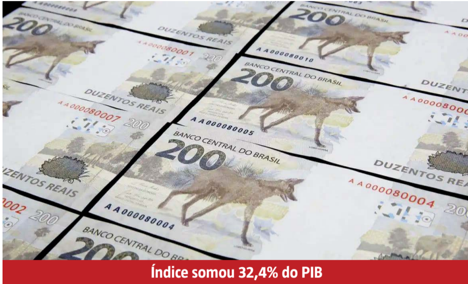
Índice somou 32,4% do PIB

Na esfera estadual, houve redução de 0,09 ponto percentual, explicada principalmente pela queda relativa na receita do Imposto sobre a Circulação de Mercadorias e Serviços (ICMS). Nos municípios,