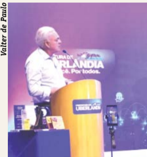
Prefeito Paulo Sérgio

ampliar o empreendedorismo, a inovação, o desenvolvimento econômico, com foco no atendimento aos empreendedores, empresários, lideranças do setor produtivo e parceiros do ecossistema de inovação.