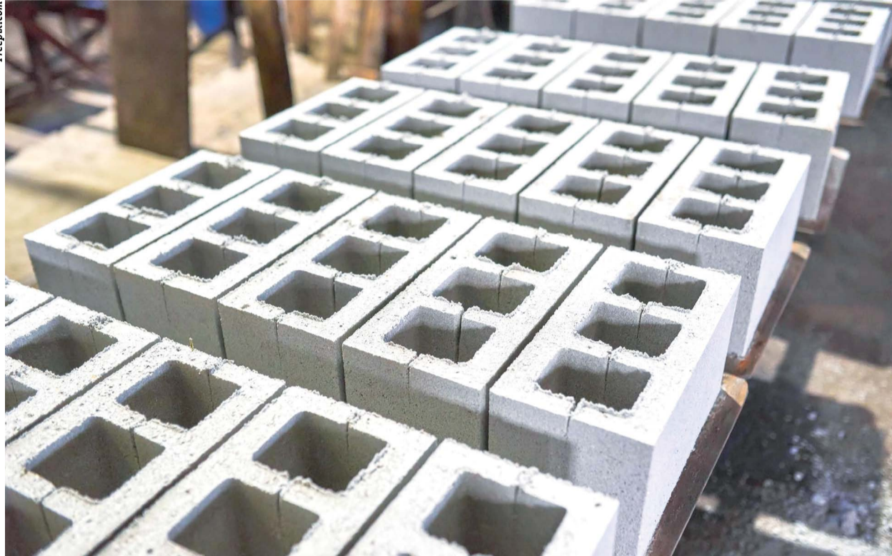
Desempenho em março foi puxado pelos materiais básicos