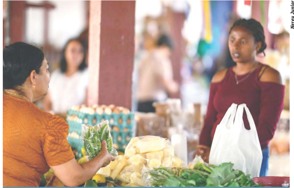
Evento será realizado entre 23 de abril e 23 de maio

A instituição avalia que o turismo gastronômico local possui potencial de crescimento, ressalta a analista. "O município tem um fluxo anual superior a 100 mil turistas, possui cerca de 460 empreendimentos de alimentação fora do