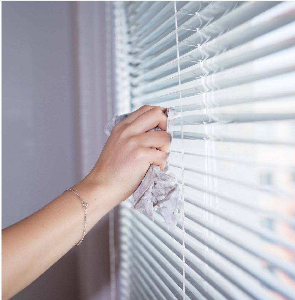
Informalidade também persiste para milhões de trabalhadores

Além das questões econômicas, o perfil da categoria evidencia um problema social mais profundo. O trabalho doméstico é exercido majoritariamente por mulheres, em sua maioria negras. “Quando você analisa os dados, vê claramente o recorte racial e de