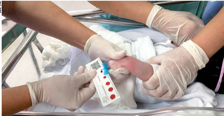
Exame é essencial nos primeiros dias de vida do bebê