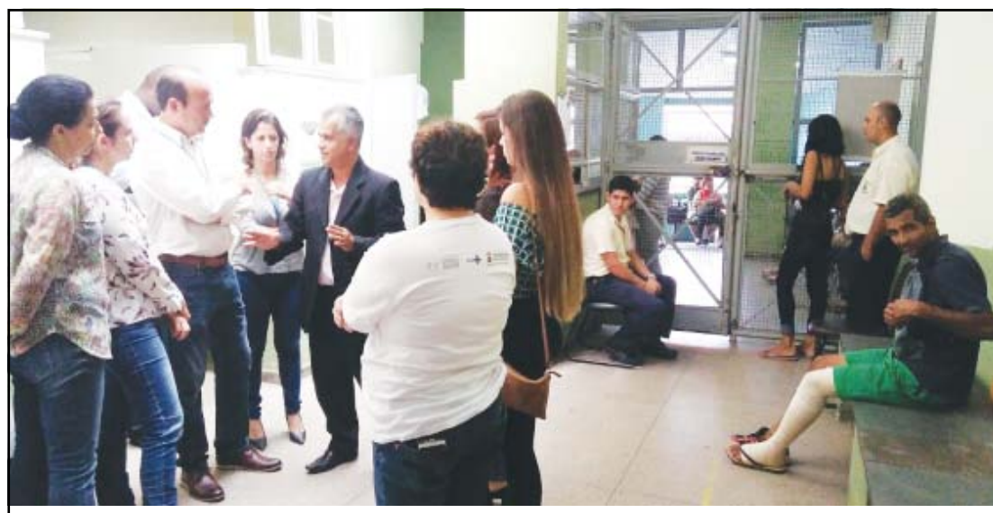
Passam pela UPA Norte quase 400 pessoas por dia