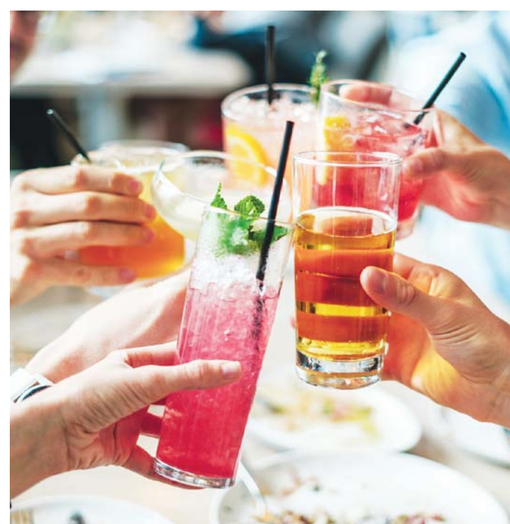
importante também é 'você consegue ficar sem beber quando quer?' Se a resposta for negativa, é um sinal eminente de dependência".