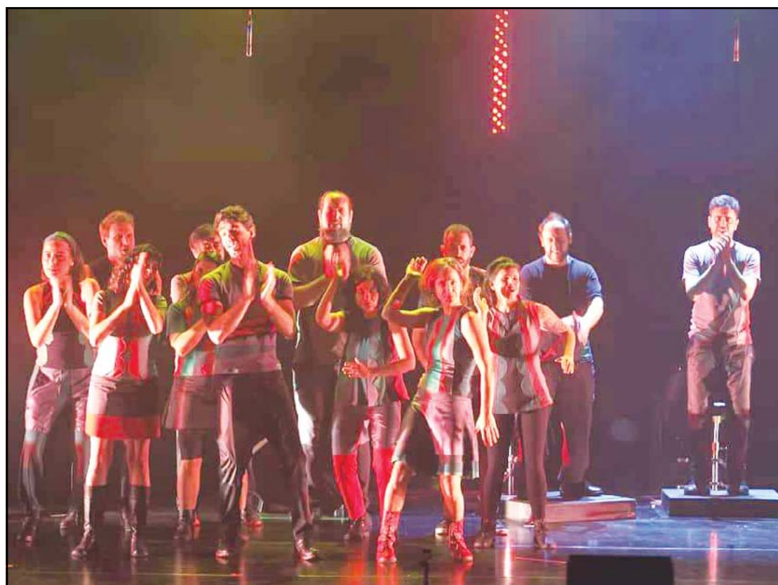
Só + 1 pouquinho é o novo projeto do Barbatuques dedicado às crianças