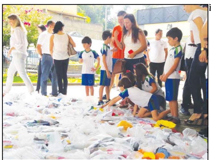
Escolas Laura Queiroz e Jayme Martins fizeram parte do projeto

Os bonecos confeccionados neste ano serão doados para uma entidade