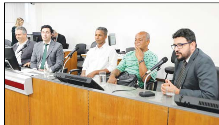
Nova audiência para discutir a situação dos ambulantes deve ser realizada em breve

A Comissão de Direitos Humanos da Assembleia Legislativa de Minas Gerais (ALMG) ouviu o apelo de representantes dos vendedores ambulantes que atuam nas ruas de Belo Horizonte. Eles pediram ajuda do Legislativo para convencer a prefeitura da capital a realizar licitação para o trabalho em logradouros públicos.