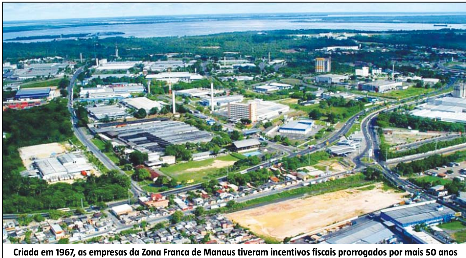
Criada em 1967, as empresas da Zona Franca de Manaus tiveram incentivos fiscais prorrogados por mais 50 anos