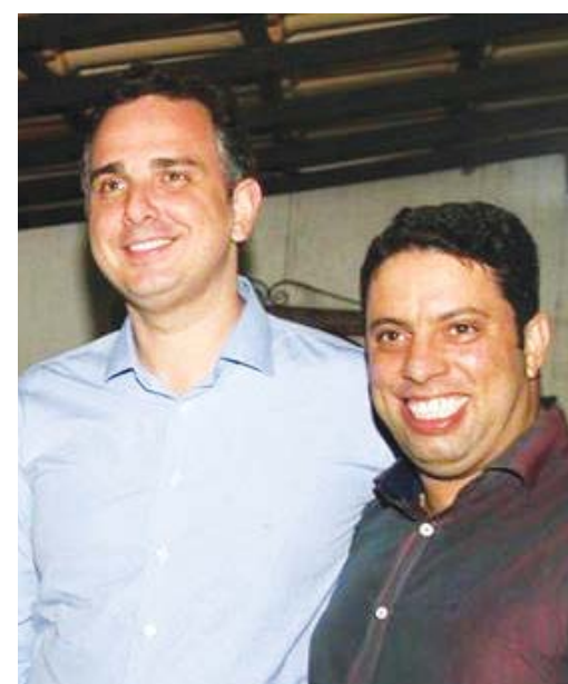
Senador Rodrigo Pacheco e o deputado Igor Timo em evento