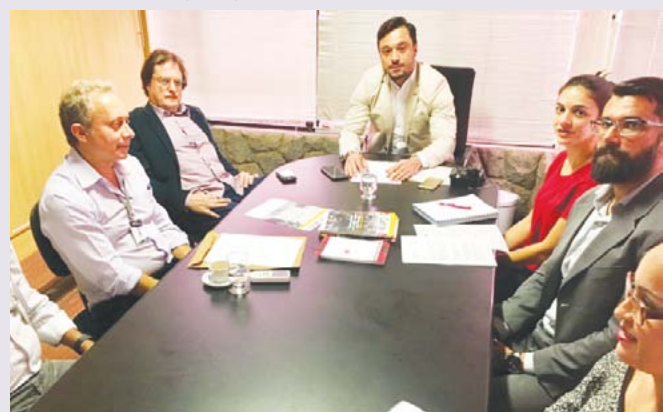
Reunião aconteceu na sede da AMM em Belo Horizonte

Mais informações pelo telefone: (31)2125-2420.