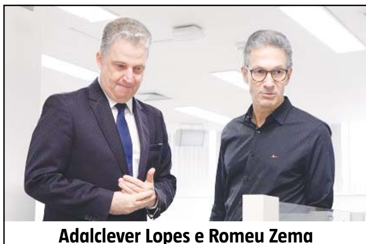
Adalclever Lopes e Romeu Zema